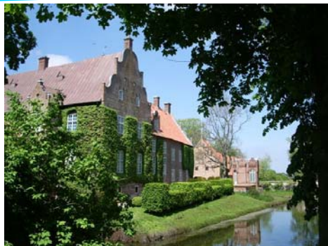
『ニルスのふしぎな旅』ゆかりのトロッレ・リェングビー城

また、スウェーデン大使館のご協力をいただき、一昨年5月にスウェーデン大使館で開催された「スウェーデン児童文学フェア」のパネルや人気キャラクター、スウェーデンの児童書(原書・日本語訳)やスウェーデンの自然や文化などを紹介する本(一般書・児童書)を併せて展示します。